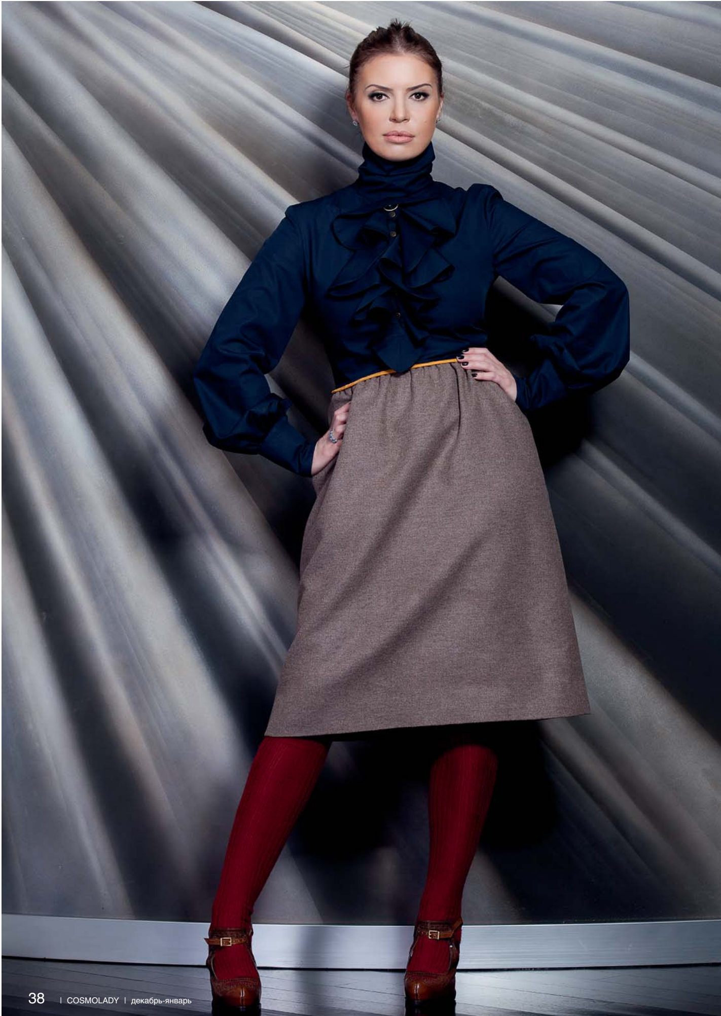
Стил, визаж: Татьяна Бойко