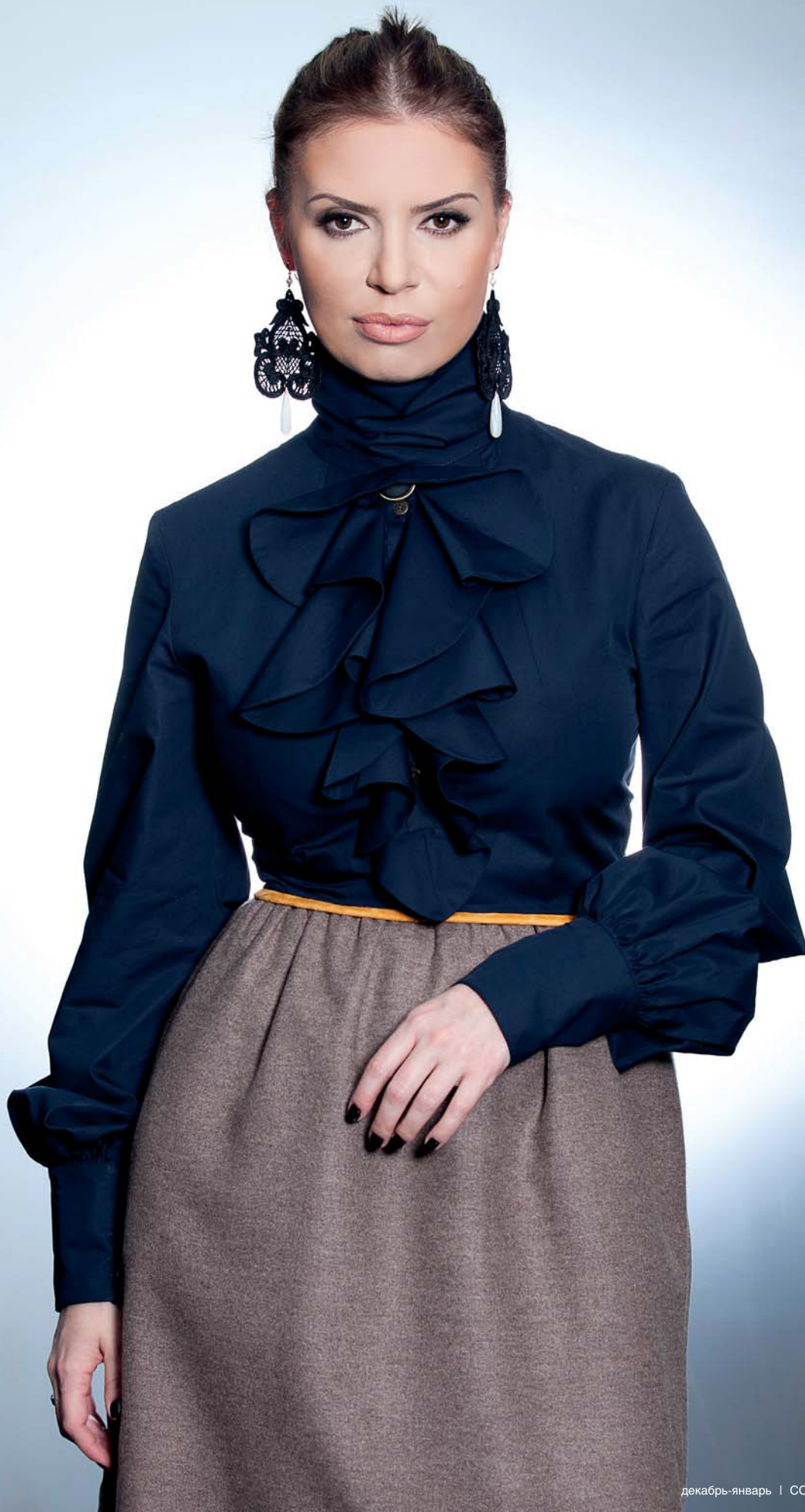
Стилъ, визаж: Татьяна Бойко